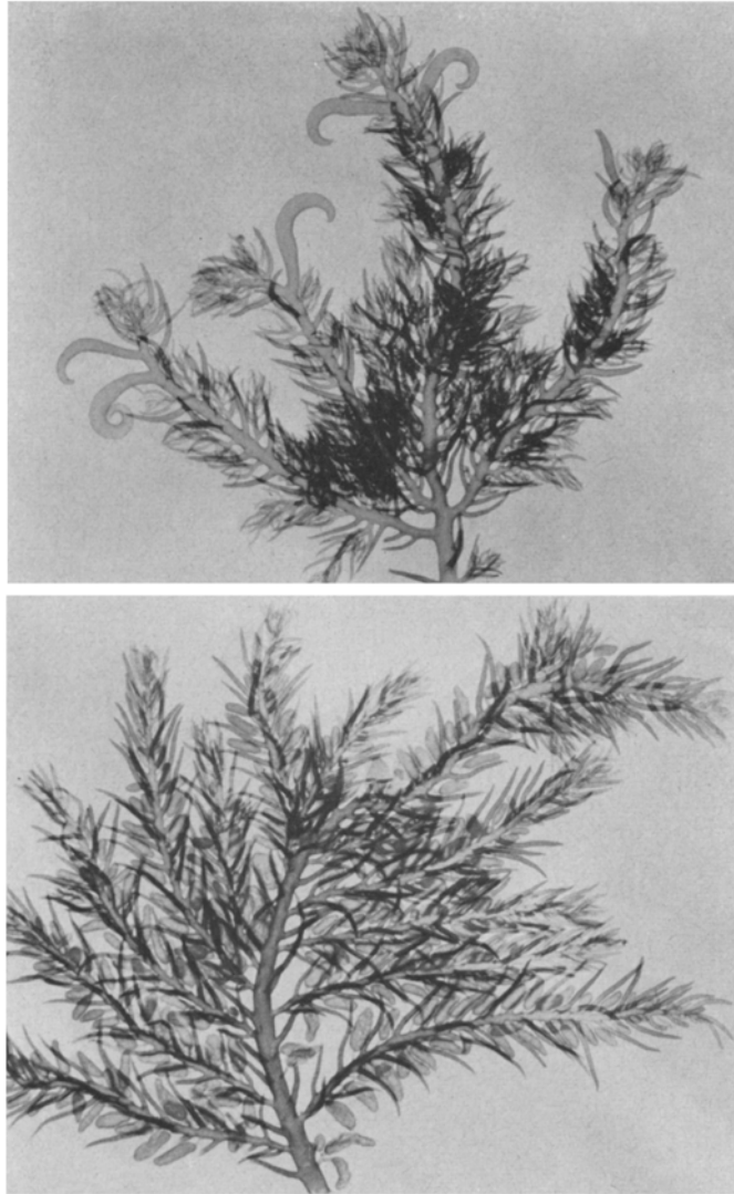
Abb. 1. Bonnemaisonia hamifera . Teil einer weiblichen (oben) und einer männlichen Pflanze. Helgoland, Juni 1962. \times 4

Bonnemaisonia hamifera ist neu für Helgoland. Sie zeigte hier im Sommer 1962 die vollständige Generationenfolge genau wie in ihrer japanischen Heimat, während im Herbst nur sterile weibliche Pflanzen gefunden wurden.